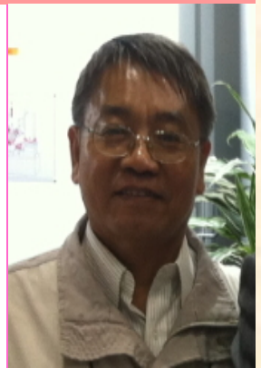
林鶴年系友，畢業於民國69年中興機械系，目前擔任精亞科技總經理。

網站的啟用即將開啟中興機械系友會的嶄新紀元。藉著無形的橋梁，中興機械大家庭的成員們可以自由自在遨遊在藍海裡，心連心，情繫情促進心靈的溝通、文章的共享、報告的批露，暢通學術的交流，公司的介紹、產品的發表、廣宣產業的訊息。讓系友們不論何時、無論何地都可以互通有無、互相關懷、互相成就健康快樂的生活網，邁向成功圓融的人生。讓系友有愛、有溫暖，一個您會喜歡回來、吸引您回來，充滿幸福溫暖的系友會。